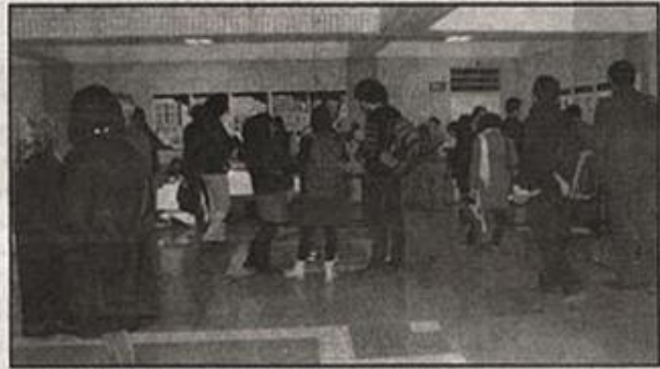
معاون تسهیلات دانشجویی صندوق رفاه دانشجویان افزود: هیچ دانشجویی وجود ندارد که در سامانه ثبت نام شهریه تقاضای خود را لایحه کرده و تسهیلات دریافت نکرده باشد. وی یادآور شد، با توجه به کم بودن اعتبار

مربوط به وام شهریه، صندوق رفاه دانشجویان نیازمند کمک دولت است و اگر برپرض تمامی دانشجویان شهریه پرداز درخواست وام کنند، با اعتبارات فعلی تنها به کمتر از ۱۰ درصد آنها امکان پرداخت وام وجود دارد. تقی زاده تاکید کرد اولویت پرداخت وام شهریه با دانشجویانی است که از لحاظ مالی با مشکل مواجه هستند. وی درباره مراحل دریافت وام شهریه توسط دانشجویان افزود: دانشجویان سند تعهد محضری با ضامن تهیه کرده و در دانشگاه مربوطه ثبت نام می کنند و از طریق دانشگاه به صندوق رفاه دانشجویان معرفی می شوند و وام مورد نظر توسط صندوق به آنها پرداخت می شود.