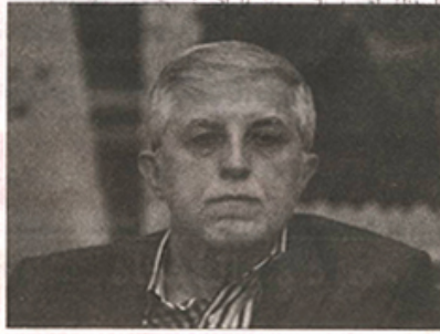
کمی بی رویه ای است که همه می خواهند دکتر شوند. تحصیل بی نفعی عیب نیست اما به لحاظ فرهنگی به گونه ای شده که برای مدرک پایین اعتباری قائل نیستیم.

شریعتی توضیح داد: بر اساس رویه جدید و پس از امتحان GRE، دانشجوی به دانشگاهها معرفی می شود و متناسب با کف امتیازی که هر دانشگاه برای خود تعریف می کند نسبت به پذیرش دانشجوی اقدام خواهد کرد و میزان سخت گیری در پذیرش در اختیار خودشان خواهد بود. به گفته وی از سال آینده آزمون تخصصی سنجش برگزار نخواهد شد. متأسفانه شاهد دخالت اجرایی ستاد آموزش عالی بوده ایم. معاون آموزشی وزیر علوم همچنین با بیان اینکه جذب هیات علمی یکی از معضلات دانشگاه هاست افزود: سعی داریم این اختیار نیز به دانشگاه ها واگذار شود. دستگاه آموزش عالی باید در جایگاه نظارتی نقش آفرینی کند تا جایگاه اجرایی، متأسفانه در گذشته شاهد دخالت اجرایی ستاد آموزش عالی بودیم و یکی از دلایل ضعف کیفی در برخی مراکز علمی، عدم نظارت درست بر آنهاست. نورخوزستان ۹۴/۰۲/۱۹