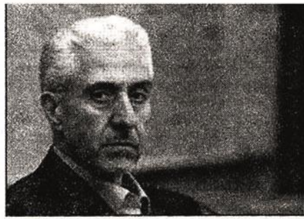
کنکور مشخص کنیم تا هر دانشجوی وارد شده به دانشگاه را بتوان از جهات مختلف مورد سنجش قرار داد. وزیر علوم، تحقیقات و فناوری خاطر نشان کرد: به نظر من باید مدل جایگزین آزمون کنکور یک مدل کارشناسی خوب و به روز باشد. نورخوزستان - سه شنبه ۲۲ اسفند

وزیر علوم، تحقیقات و فناوری گفت: خوشبختانه در حال حاضر هیچ دانشجوی ستاره داری در کشور نداریم. منصور غلامی در گفت و گو با ایسنا، اظهار کرد: از نظر من در حال حاضر هیچ دانشجوی ستاره داری در کشور وجود ندارد. وی افزود: قضیه دانشجویان ستاره دار از ریشه تمام شده است و برای اسامال هیچ موردی در این زمینه نداریم. وزیر علوم، تحقیقات و فناوری تصریح کرد: خیلی نباید این